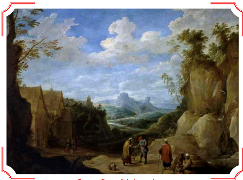
TENIERS DAVID, Paisaje con gitanos (1641-1645) Museo del Prado, Madrid

—Imagino que, si esto es algo así como un juego, habrá que seguir un orden. Está claro que no quieren que aquí haya mucha luz. Veamos de cerca el siguiente cuadro.