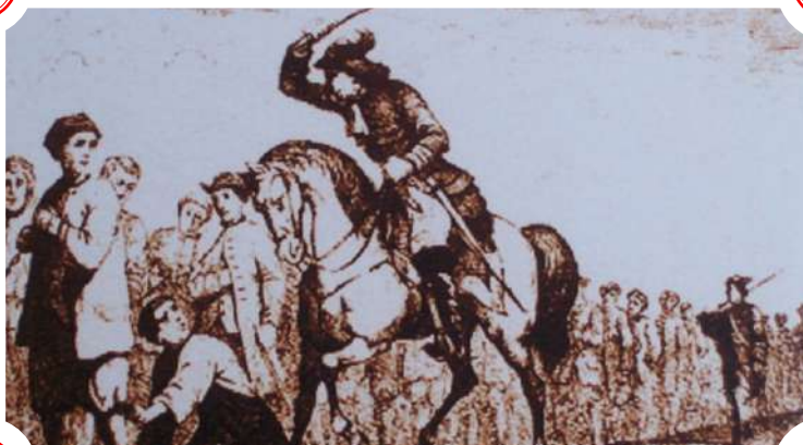
Grabado francés de una cadena de presos del siglo XVIII.