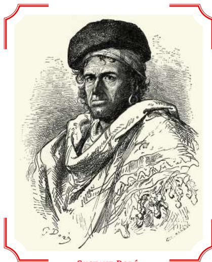
GUSTAVE DORÉ, Rico, el gitano (1881)

El gitano mayor, al que el Maño llamó con respeto «abuelo», saludó al niño con cariño. Al descubrir a los dos jóvenes que lo acompañaban, enseguida les ofreció asiento y fruta, que trajo una gitana en una cesta. La hospitalidad de aquella gente, que compartían lo poco que tenían, era asombrosa.