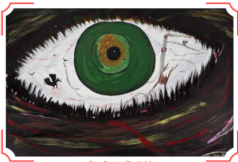
CEIJA STOJKA, [Sin título] (1995). Fondation Antoine de Galbert, Paris

gados. Los apuntaba con una pistola. Ellos vieron su figura y la boca del arma en los ojos enormes de Ceija, que los abría, asustada, mirando al soldado. Unos ojos que, de pronto, lo llenaron todo. El mundo se había transformado en una única pupila desmesurada, verde, y era un cuadro pintado por la mano de Ceija Stojka, esa mano huesuda y ancha, ya vieja.