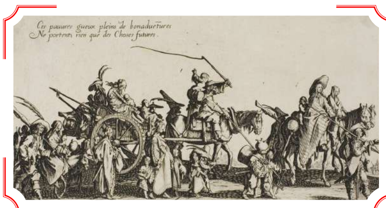
JACQUES CALLOT, Los gitanos en marcha: la retaguardia (1621-1625). Biblioteca Nacional de Francia, París

—Qué extraño. Hubiese jurado que hace un momento la sombra no tenía nada en la mano. Este cuadro se llama Los gitanos en marcha y representa la llegada de los gitanos a España. Y ahora parece que tiene algo...