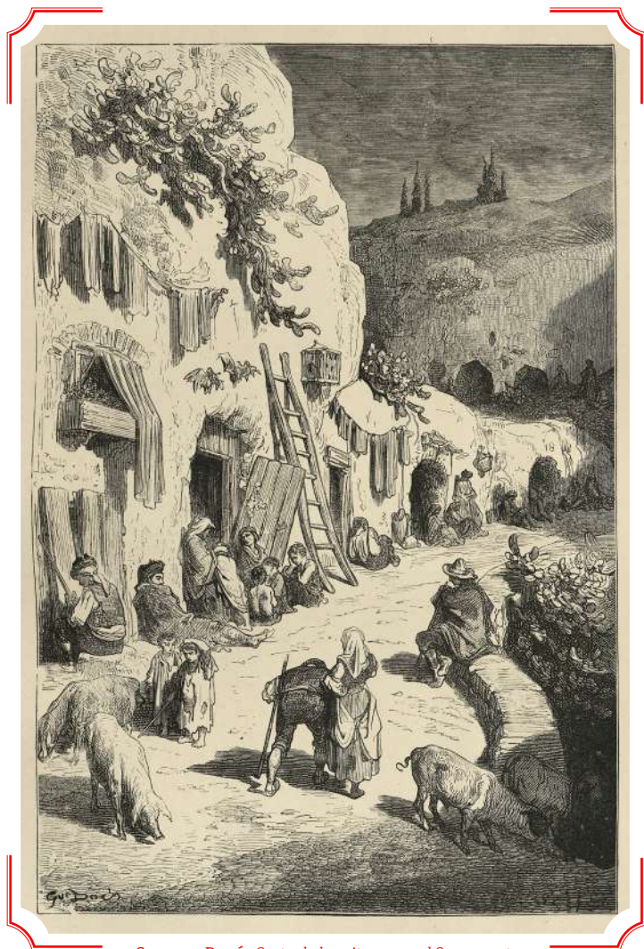
GUSTAVE DORÉ, Gruta de los gitanos en el Sacromonte (1862). Colección privada

mina no la conocía Diego, pero sí las ilustraciones que había hecho el artista francés para el libro del Quijote . Su trabajo le impresionaba. Incluso había intentado evocar su estilo en algunos de sus dibujos, por eso reconoció inmediatamente su mano. Achicó los ojos y confirmó su autoría en el cartel que acompañaba el cuadro.